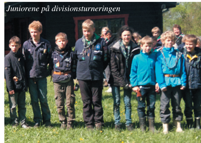
Juniorerne på divisionsturneringen

Vores første fællesmøde var et lagkagestjerneløb med poster ved begge hytter og fælles lagkagspisning til sidst.