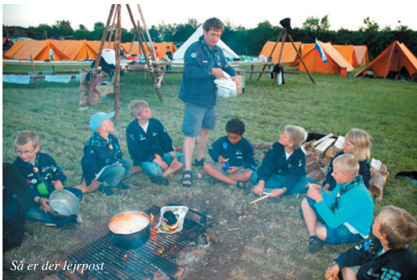
Så er der lejrpost

aftensmad på bål, hvor lederne ikke havde haft så meget som en halv finger i gryden.