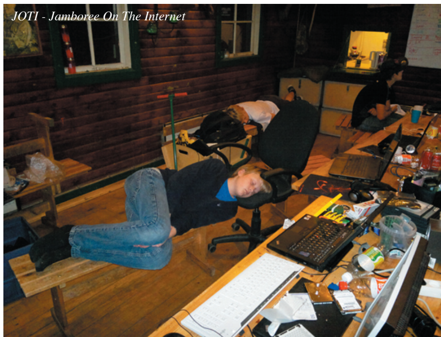
JOTI - Jamboree On The Internet