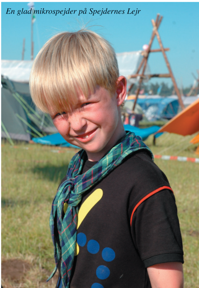
En glad mikrospejder på Spejdernes Lejr

I 2012 har mikroerne været meget aktive som altid. Ud over møderne har vi været på Divisions-turnering på Gurreddam. Vi var 6 afsted, og vi klarede os fint i de forskellige discipliner, herunder lejrarbejde, hvor mikroerne konstruerede et rafte-stativ til at holde en vanddunk!