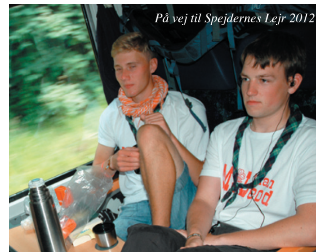
På vej til Spejdernes Lejr 2012

Fra Senior Divi indtil 2012-lejren (Spejdernes Lejr 2012) var der blandede sociale seniorarrangementer som skovturen. Her fik vi hilst på en masse andre seniorer.