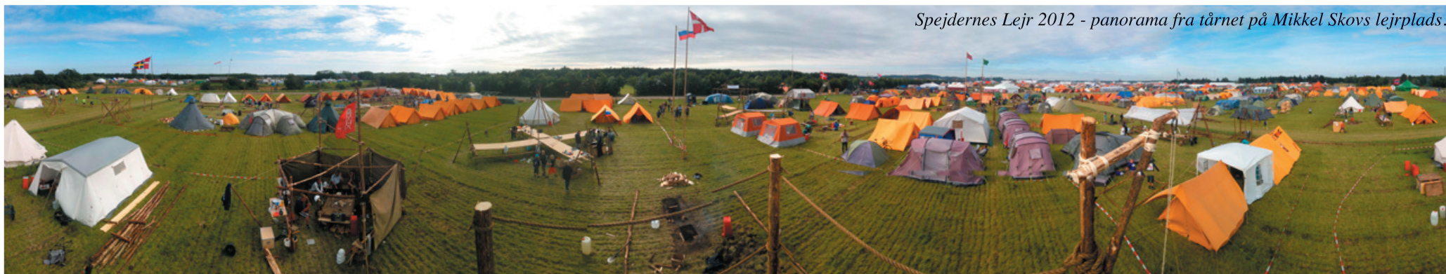
Spejdernes Lejr 2012 - panorama fra tårnet på Mikkel Skovs lejrplads.