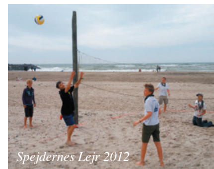
Spejdernes Lejr 2012