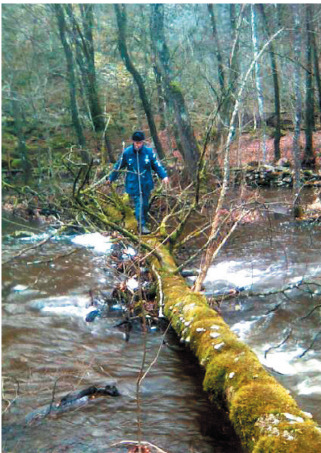
Dejlig efterårsnatur ved Gillastig i Skåne

en mindre tøsedreng indeni, for lige pludselig var der meget langt ned fra tårnets øverste dæk. Men sommerlejren var nok årets største oplevelse, som jeg vil mene var meget heldig med vejret, da det var den eneste uge i løbet af sommeren, hvor solen skinnede.