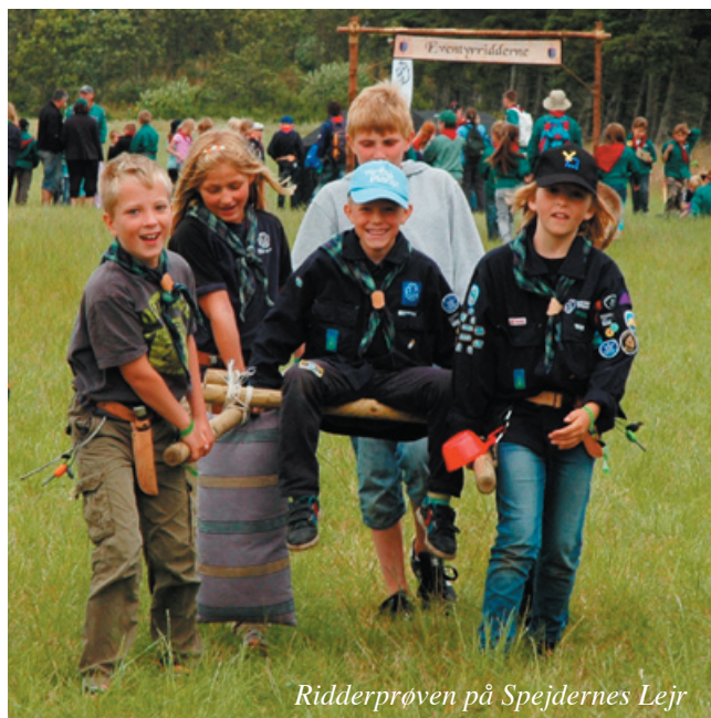
Ridderprøven på Spejdernes Lejr