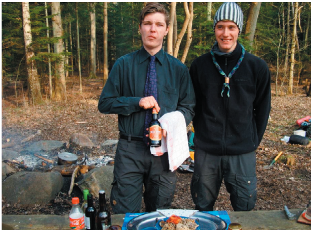
Cool servering for dommerne på seniordivisionsturneringen

også en strand-racer og kørte med den. Det var en stor oplevelse for alle, og alle kom godt igennem, dog meget udmattede!