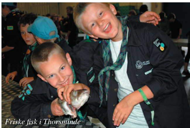
Friske fisk i Thorsminde

I juni mødtes vi til Skæg & Blålys (spejder-tivoli) på Islands Brygge for alle i Amager Division. Vi havde også fælles spejdermøde på fortet med de øvrige lokale spejdergrupper, som vi