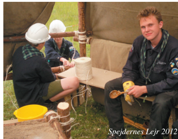
Spejdernes Lejr 2012

Juli måned var vi på årets store sommerlejr, "Spejdernes