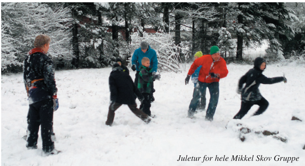
Juletur for hele Mikkel Skov Gruppe