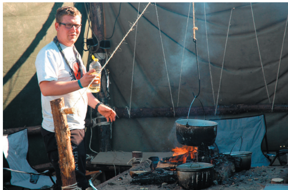
Gang i gryderne i "Slyngelstuen"