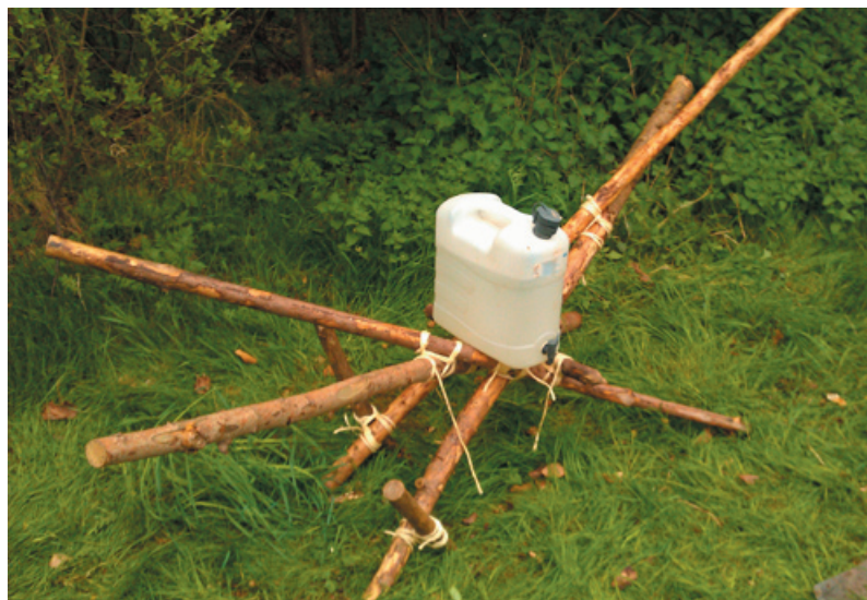
Vanddunk-holder efter eget design

På sommerlejren deltog mikroerne i halv lejr og det var en stor oplevelse at være blandt så mange spejdere. For mikroerne var det også stort at skulle være så længe væk hjemmefra, "alene" uden far og mor. Men de klarede det storartet, og over de fem lejr-dage blev vi tømret godt sammen i mikrogruppen.