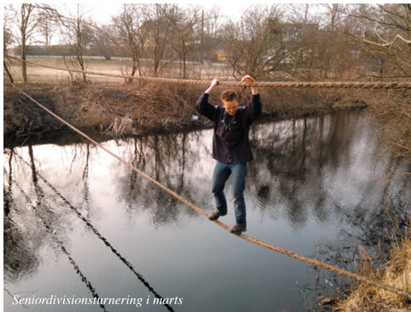
Seniordivisionsturnering i marts

Cirka hver 2. måned holder divisionen fælles tropsmøde. Det plejer at være stort at møde de andre spejdere fra øen. De forskellige grupper skiftes til at planlægge, og holder det typisk i deres egen hytte på deres normale mødedag, så det er ikke altid vi kan møde lige talstærkt. Vi afholdt et møde på Kongelundsfortet i efteråret, hvor de ældste spejdere selv havde lagt programmet.