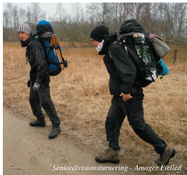
Seniordivisionsturnering - Amager Fælled

Årets første tur var Senior Divi, seniorenes divisionsturnering. Gennem en spændende og udfordrende weekend, hvor der skulle findes breve fra Absalon, stjæles dokumenter fra satanister, kigges på stjerner med Tycho Brahe og meget, meget mere, blev vi sat på plads af to ledere i gruppen, der pressede os hårdt på point, men vi fik stadig vandrepokalen med hjem fra konkurrencerækken.