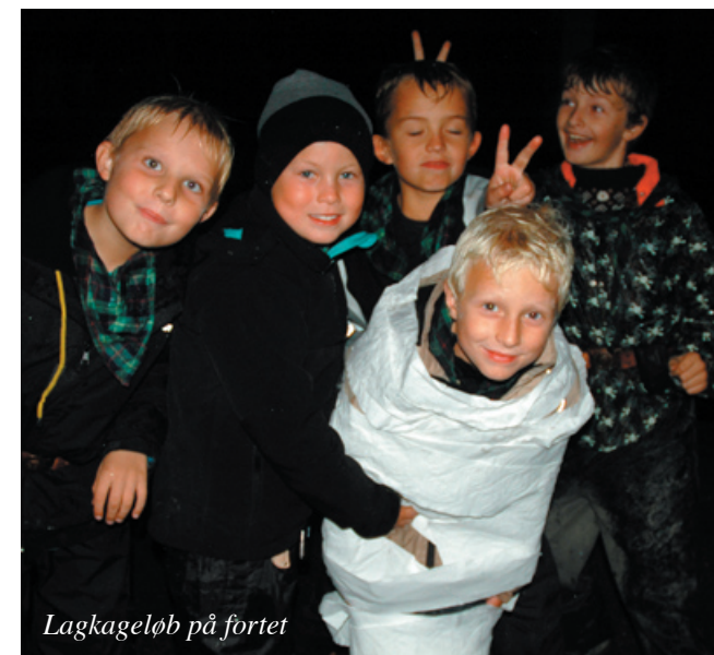
Lagkageløb på fortet

Sommerlejren i Holstebro sammen med 36.000 andre spejdere var virkelig alt, hvad vi havde drømt om. Vejret var fantastisk, og vi havde 5 skønne dage sammen med 13 ulveunger. Vi etablerede lejr i Trækullet sammen med resten af Mikkel Skov, vi var på ridderturnering, deltog i en slags forsøgsstation og tilberedte friskfangede fisk over gløder i Thorsminde - helt ude ved Vesterhavet og Nissum Bredning. Det er vores indtryk, at ulveungerne voksede med