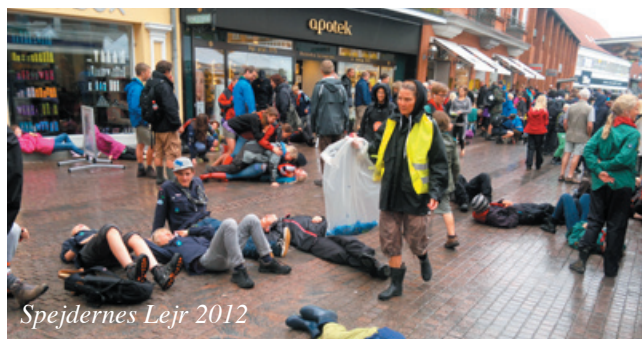
Spejdernes Lejr 2012

dam spejdercenter i maj måned, at troppe for alvor kom af sted. I 2010 og 2011 var vi stærke, og forventningerne til 2012 var derfor store. Vi vandt da også en del præmier, bl.a. igen bedste trop, men dog ikke helt lige så mange præmier